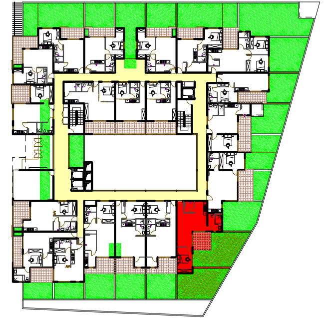
Plan du R+1 sans échelle