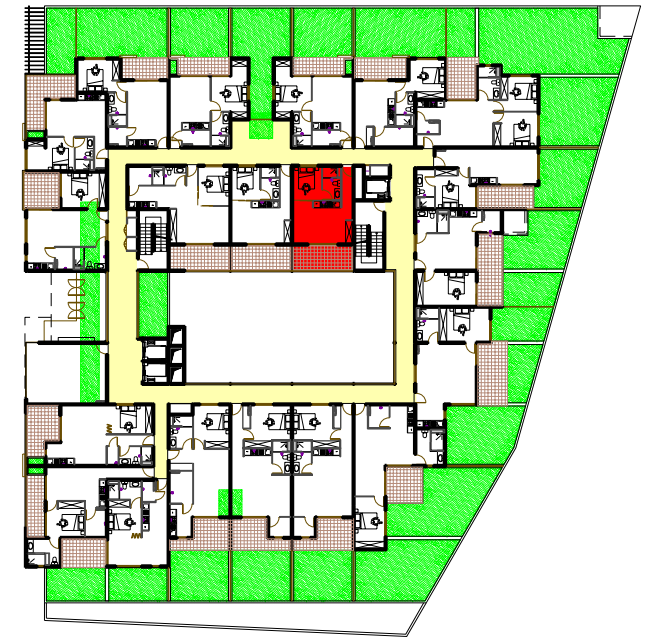
Plan du R+1 sans échelle